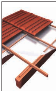
Telhados cerâmicos novos.

Subcoberturas novas ou existentes - abaixo de telhados residenciais e industriais, pisos e dutos de ar condicionado. Thermo-Foil-T Tramado deve ser instalado com distância de no mínimo 2cm das superfícies quentes, para criação de câmara de ar adequada. Sobreposições devem ser de 10cm.