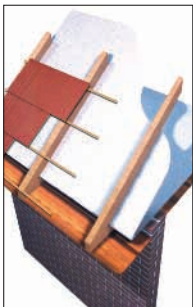
Telhados cerâmicos existentes.