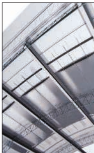
Galpões novos ou existentes.